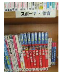
独自の分類ごとに色分けしている