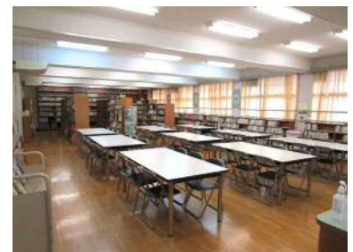
図書館内全体写真（閲覧机9台）