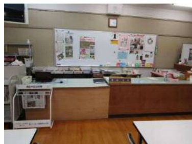
カウンター・中学生新聞コーナー