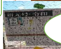
元号発表当時の新聞