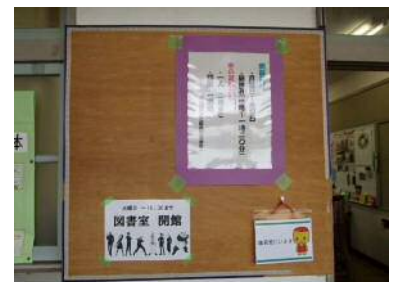
図書館の開館日や利用時間などの掲示物を作った