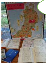
奥の細道の行程と関連本