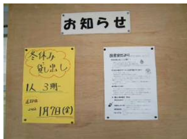
お知らせと図書館だよりを掲示