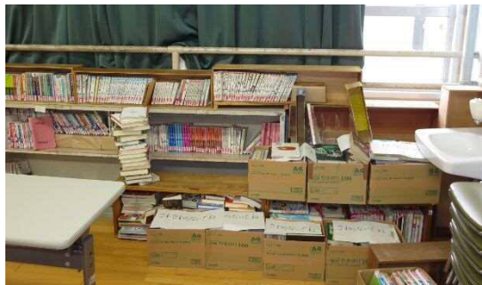
2021.09.17 図書館内撮影 整理中(メモ書き貼付あり)

図書館の清掃当番の児童がよくやってくれる。通常は掃除をしてくれているが、私が在館の時は、分類シールを貼ったり、新刊の配架準備を手伝ってくれたりした。廃棄図書の処分も4階から1階のゴミ捨て場まで何度も往復してくれた。昼休み等休み時間も図書館で本を借りた後、「何かお手伝いすることはないか?」と聞いてくれ、手伝ってくれる。図書委員のサポートもあるが、掃除当番生徒のサポートもありがたい。