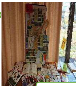
令和の基となる万葉集記述