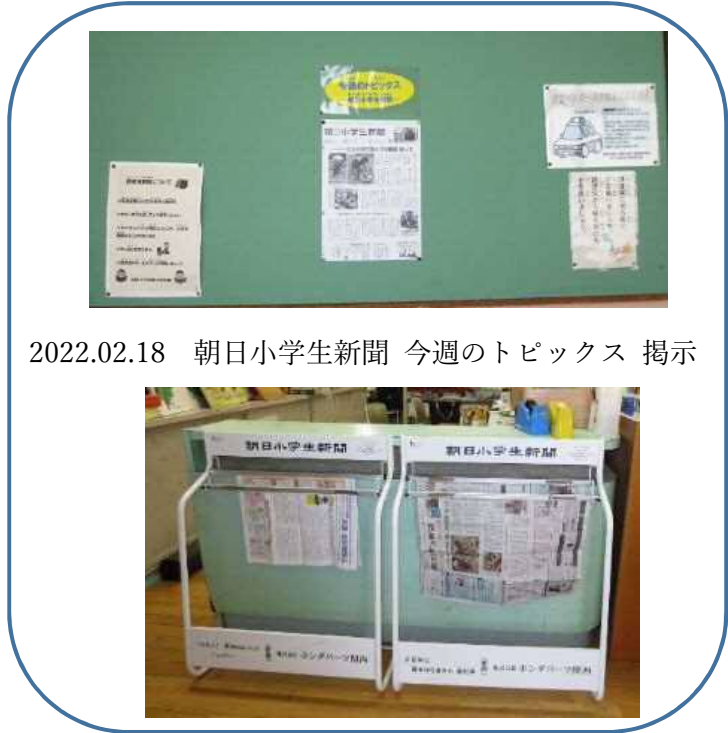
2022.02.18 朝日小学生新聞 今週のトピックス 掲示