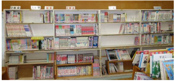
文学(日本 青・外国 赤)

五十音見出し設置 日本文学 青の分類シール貼付中 外国文学 赤の分類シール貼付中 外国文学は、 赤で行別見出し板作成中