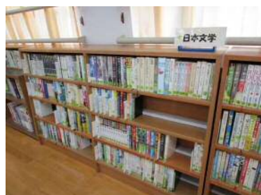
日本文学コーナー 作家名サイン(あいうえお順)