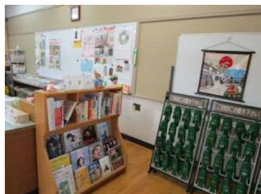
雑誌コーナー・館内用スリッパ