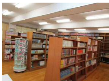
学校独自の配架で並べられている