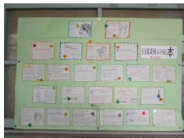
図書委員会がおすすめの本を紙に書いて掲示している