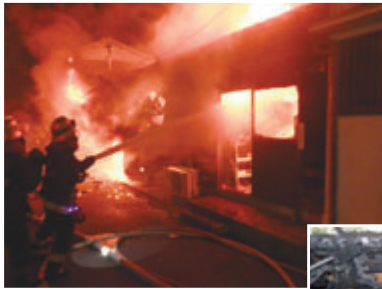
消火活動を行う消防隊(上)、火災後のこんろ(右)