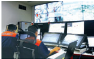
消防局通信指令室の様子

さまざまな通報手段も、皆さんの協力によって活かされます。一人でも多くの命を助けるために、皆さんで助けあひ、支えあっていきましょう。