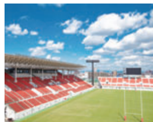
市花園ラグビー場第1グラウンド

新成人を祝う成人祭を市花園ラグビー場で開催します。対象者には、12月上旬に案内状を送付します。