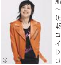
① ② ③ FZテレビジョン

②) 料7800円 ※全席指定。未就学児入場不可。 申 6月26日(土)から次の申込先へ 市文化創造館チケットセンター 0570(08)1515(第2火曜日を除く10時～16時) 市文化創造館オンラインチケット(右のコードからアクセス可) 市文化創造館窓口(第2火曜日を除く10時～17時) 申 チケットぴあ 0570(02)9999(Pコード198-489) 申 ローソンチケット(Lコード52308) 申 CNプレイガイド 0570(08)9999 申 イープラス(右のコードからアクセス可)