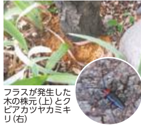
フラスが発生した木の株元(上)とクビアカツヤカミキリ(右)

このカミキリは市内の公園や道路など、公共施設や民有地に広く生息しているおそれがあります。生息分布の拡大を防止するためには、早期発見・防除が重要です。このカミキリは人体には害がない昆虫ですので、見つけた場合は速やかに捕獲(駆除)し、発見場所などの情報提供をお願いします。