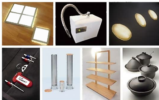
デザインプロジェクト (モノづくり支援室)