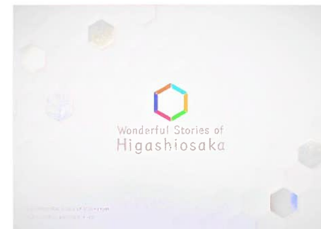
Wonderful story of higashiosaka (英語版) (モノづくり支援室)