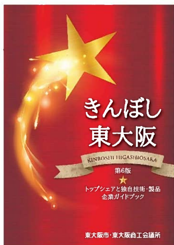
きんぼし東大阪(第6版) (モノづくり支援室)