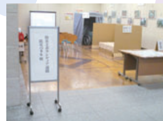
防災パネル展の様子

☎1月15日(金)9時～16時 所市役所本庁舎1階多目的ホール 阪神・淡路大震災や東日本大震災の状況および教訓、地震の備えについてなどのパネル展示、災害用備蓄物資や発電機・投光器などの資機材の展示、震災関連ビデオ・DVDの上映