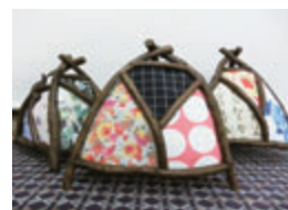
木枠と布製のあんどん (作例)

時 2月10日(水)13時30分～15時30分 定 18人 料 1800円 ※ランプは別途 1300円が必要。 持 マスク、タオル