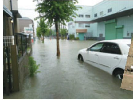
市内で発生した浸水被害(左)、土砂災害(右)