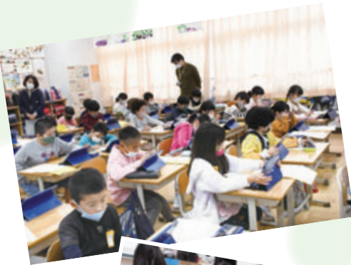
タブレットを活用した桜橋小学校の授業の様子