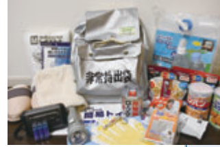
非常持出品の一例

食料品、飲料水、応急医薬品、マスク、アルコール消毒液、体温計、石けん、上履き(新型コロナウイルスなどの床からの感染防止のため)、携帯ラジオ、懐中電灯、乾電池、笛、衣類、生理用品、赤ちゃん用品、現金(小銭は多めに)、保険証(写し)、預貯金通帳、印鑑、ライター、軍手、ロープ、タオル、カイロ、老眼鏡など