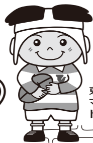
東大阪市 マスコットキャラクター トライくん