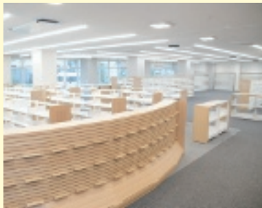
広々とした空間の中で ゆったりと過ごせます

また、「ビジネス支援コーナー」を設け、これから事業を始めようとする人、営業や企画のためのデータを探している人、キャリアアップしようとする人などに必要な資料や情報を提供します。