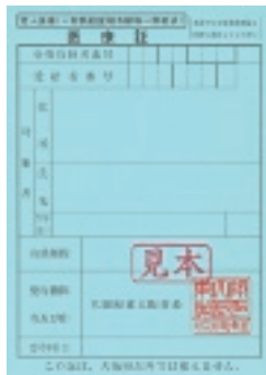
新しい老人医療証