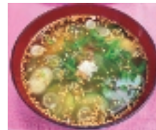
汁が落ちたときは冷やがおすすめです

(1人分の栄養価：エネルギー54 kcal、塩分1.2g、野菜38g) 材料(2人分) 絹ごし豆腐60g、きゅうり60g、みょうが1個、青じそ2枚、だし汁1と1/2カップ、味噌大さじ1、いりごま小さじ2