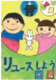
昨年の最優秀市長賞受賞作品

3Rの推進、地球環境の保全、環境美化に関するポスター作品を募集します。優秀作品は表彰します。市内在学の小・中学生 規格 4つ切りで縦横は自由(1人1点のみ) テーマの例 マイバッグ・マイボトルの活用、食べ残しなどの「食品ロス」の削減、プラスチックごみの削減、無駄な電気やガスの節約など省エネルギーに対する心がけや実践、不法投棄の禁止など 9月13日(金) (消印有効)までに郵送または直接 ※詳しくは市ウェブサイトをご覧ください。