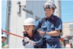
ロープ渡過体験を学ぶ子ども

8月16日(金)14時～15時30分、17日(土)10時～11時30分 子どもとその家族 各40組(抽選) 参加者全員の基本事項(12面に掲載)と参加希望日(あれば第2希望も)を7月28日(日)(必着)までに往復ハガキで 所 578-0925稲葉1-1-9 消防局防災学習センター 消防局予防広報課 072(966)9662、RX072(966)9669