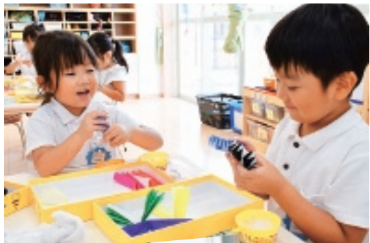
認定こども園で楽しく元気に過ごす子どもたち