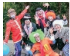
ちやいるとほすまいのクラウンショー

5月5日(木)10時45分～11時15分・14時10分～40分＝クラウンショー 6日(金)11時15分～45分・13時30分～14時＝Duo Malletsによるマリパ演奏 所 ドリーム21 072(962)0211、RVO72(962)0810