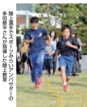
陸上選手でスポーツみらいアンバサダーの多田修平さんが指導した陸上教室