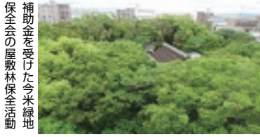
補助金を受けた今米緑地保全会の屋敷林保全活動