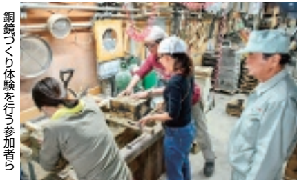
銅鑄づくり体験を行う参加者

昨年には、体験型観光プログラムイベント「ひがしおおさか体感まち博2018プレ」として、「グルメ」「歴史・文化・伝統」「モノづくり」「スポーツ・アクティビティ」の4