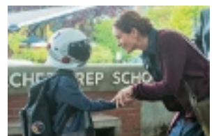
Motion Picture Artwork © 2018 Lions Gate Entertainment Inc. All Rights Reserved.

■ 申込 577-8521市役所人権啓発課 06(4309)3156、06(4309)3823、jinkenkeihatsu@city.higashi-osaka.lg.jp