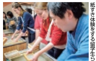
紙すき体験をする留学生ら