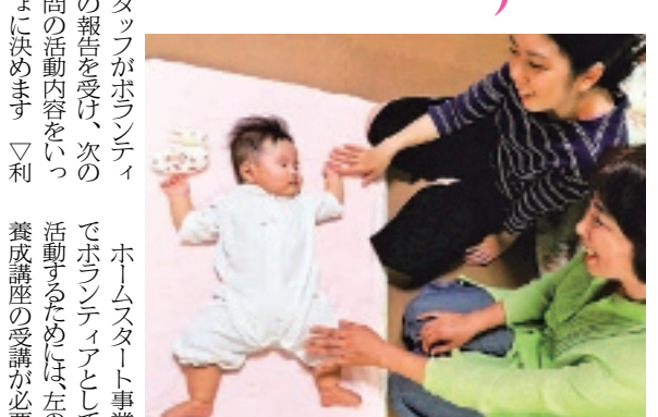
ホームスタート事業でボランティアとして活動する様子