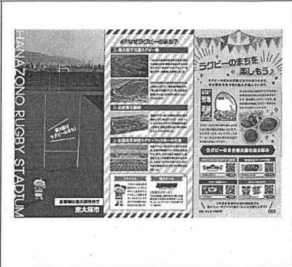
③-1 ラグビーのまち紹介POP ラグビーのまち編