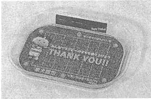
① つり銭トレイ ※本体は透明色