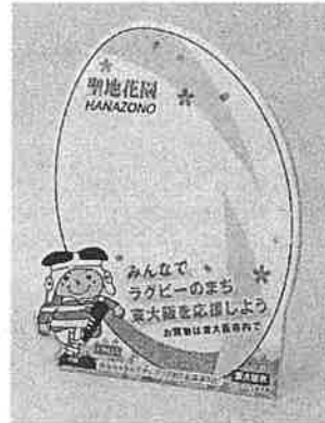
②メッセージボード