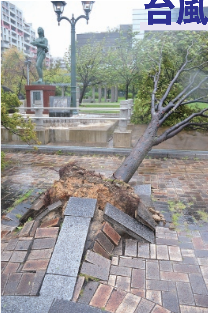
強風により、なぎ倒された街路樹