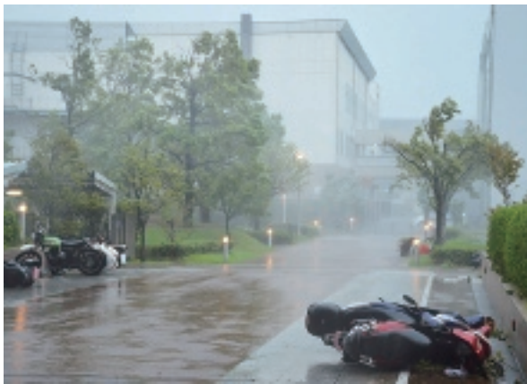
台風が最接近した市役所周辺の様子

り災証明受付窓口を市役所本庁舎5階に設置しています。台風第21号により住家の被害に遭われた方で「り災証明書」が必要な方は手続きをお願いします。 毎月曜日・金曜日 9時~17時