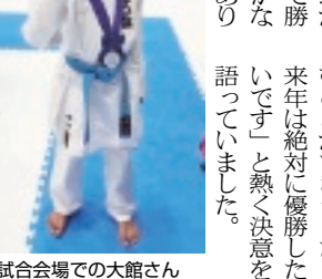
試合会場での大館さん

市長は「自分の心と向きあって決勝まで進むことができました。来年は絶対に優勝したいです」と熱く決意を語っていました。