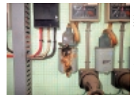
破裂・溶融した低圧進相コンデンサー