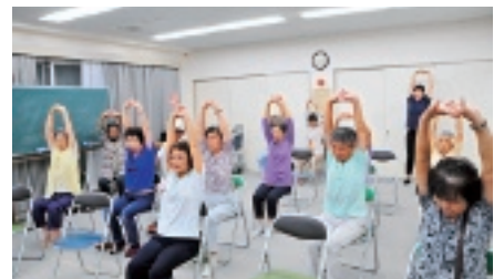
8月24日、カフェ「わら輪」で行われた認知症予防体操

おいしいお料理を囲みながら、日頃の介護にまつわる「あれこれ」おしゃべりしませんか。福祉・介護専門職による無料相談もあります。10月25日(内)11時~14時 市U・コミュニティホテル1階(御厨栄町1) 在宅で認知症の人など高齢者を介護している市内在住の方 40人(抽選) ※参加者には参加証を後日送付。料1000円(昼食付き) 申し込み名、住所、氏名(ふりがなも)、年齢、電話・ファクス番号、介護期間、介護についての相談ごとを10月15日(月)までに電話またはファクスで 角田地区(基幹型)地域包括支援センター市社会福祉協議会角田 072(963)6663、FAX072(963)2020