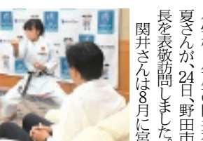
試合会場での大館さん

市長は「自分の心と向きあって決勝まで進むことができました。来年は絶対に優勝したいです」と熱く決意を語っていました。