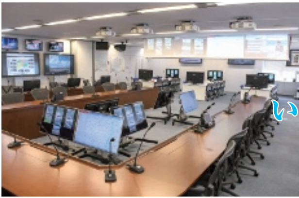
市役所本庁舎5階の危機管理センター