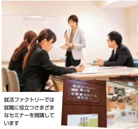
就活ファクトリーでは就職に役立つさまざまなセミナーを開催しています