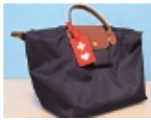
ヘルプマークはカバンなど、目立つ所につけましょう。

中・西保健センター ※ヘルプカードは市庁エブサイトからダウンロードし、印刷のうえ利用できます。障害種別、等級、病名などによる条件はありません。配布は無料です。