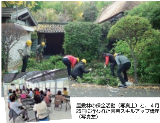
屋敷林の保全活動(写真上)と、4月25日に行われた園芸スキルアップ講座(写真左)

みどりあふれるまちづくりのため、市では花づくり学習会や植樹資金の助成などを行っています。ぜひご参加、ご活用ください。