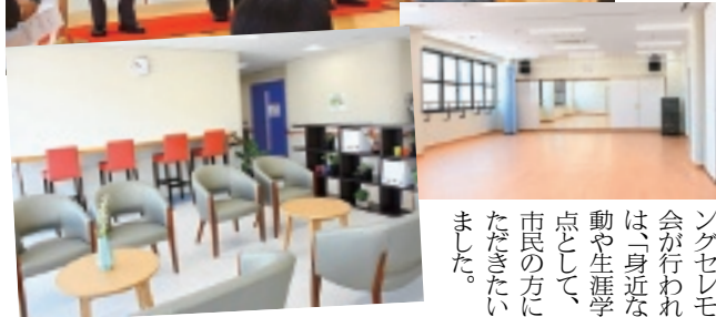
4月29日に行われたオープニングセレモニー(写真左上) 大会議室(写真右上)とラウンジ(写真左下)

4月29日、オープニングセレモニーと内覧会が行われ、野田市長は「身近な社会教育活動や生涯学習活動の拠点として、たくさんの方々に利用していただきたい」と挨拶しました。