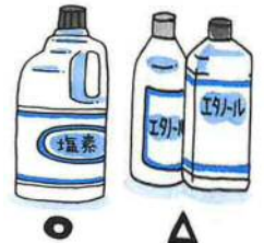
塩素系漂白剤 消毒用アルコール

・処理後は処理物をビニール袋に捨て消毒液を入れて密封してください。処理をした後の手洗いを忘れずをお願いします。