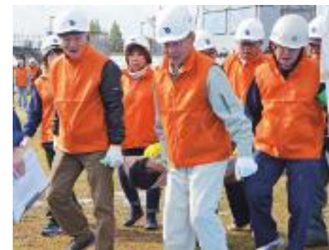
共助の大切さを確認した11月の総合防災訓練

地域の力と きずなで減災 市をはじめ各防災関係機関は災害に備えるためさまざまな対策を講じています。しかし、大規模災害が発生したときには公的な力だけでは十分な支援をすることができません。 阪神・淡路大震災では倒壊家屋の中から救出された人のうち、約8割が家族や近所の住民によって救出されたという調査結果があります。被害を最小限に食い止めるためには、地域の皆さんの協力が不可欠です。日頃から、近所の人同士で挨拶や声をかけをし、災害時に助けあいができるような関係性を築いておきましょう。