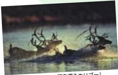
「夕暮れの極北の河を渡るカリブー」