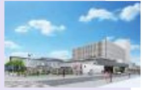
文化創造館完成イメージ

平成31年9月にグランドオープン予定の文化創造館のイベントとして、関西フィルハーモニー管弦楽団による木管五重奏・金管五重奏コンサートを開催します。 ③ 3月3日(土)14時～15時40分(予定) ④ 府立中央図書館ライティホール ⑤ 市内在住・在勤・在学(いずれか)の方 ※0歳児から入場可。 ⑥ 370人(抽選) ※別途、車いす席4席あり。 ⑦ 「天空の城ラピュタメドレー」「サウンド・オブ・ミュージック」など ⑧ 基本事項(15面に掲載)と希望人数(2人まで)、市外在住の方は勤務先または学校名、車いすの方は台数を1月31日(必着)までに往復ハガキで ※重複申込不可。詳しくは文化創造館ウェブサイトまたは募集チラシをご確認ください。