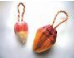
秋成が晩年愛用した幻のア タシ筆の試筆をぜひ見たい

上田秋成をはじめ河澄家ゆかりの 文化人の墨蹟を展示します。 時 1 月18日(休)～2月9日(金)9時30分～16 時30分 ※月曜日は休館。 所 旧河澄家(日下町7) 072 (984) 1640 (R&V兼用)