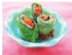
もおいしくでき ます

(1人分の栄養価:エネルギー 24kcal、塩分0.3g、野菜95g) 材料(2人分) 白菜120g、ほう れん草40g、にんじん30g、しょうゆ 小さじ1弱、レモンの絞り汁小さじ 1・½、かつお節2g