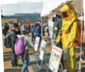
各種防護服などの展示