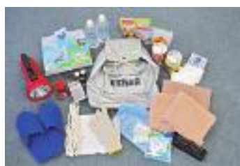
リュックサックなどにまとめ、中身はときどき見直ししましょう