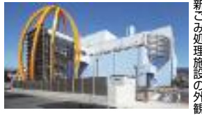
新ごみ処理施設の外觀

4月採用予定の職員(上級機械)を募集します。日本国籍の有無にかかわらず受験できます。なお、交替制で夜間勤務があります。 ④昭和63年4月2日以降生まれで、学校教育法による大学(短大を除く)または高等専門学校(専修学校・専門学校を除く)の専攻科をすでに卒業または3月卒業見込みで、それぞれの専門課程を修了または3月修了見込みの方 ④1人 ④選考日 ▶第1次=1月21日(日) ▶第2次=2月6日(火)(予定) ▶第3次=2月21日(火)(予定) ④合格発表 ▶第1次=2月1日(火) ▶第2次=2月16日(金)(予定) ▶第3次=3月2日(金)(予定) ④申込書を1月10日(木)までの8時30分~16時45分に直接 ※土・日曜日、祝休日、年末年始を除く。申込書は東大阪都市清掃施設組合ウェブサイトからダウンロード可。