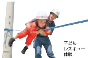
子どもレスキュー体験