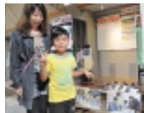
ロボットを作った親子も展示に来場

10月21日、布施北高 校で親子モノづくりの体 験教室「端材バイキン グ」が開催され、7組 23人の家族連れが参加 しました(左写真)。