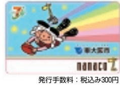
発行手数料：税込み300円

発売日 11月7日(水) 販売場所 市内のセブ ン・イレブン店舗およ び大東市・四條畷市の 一部店舗