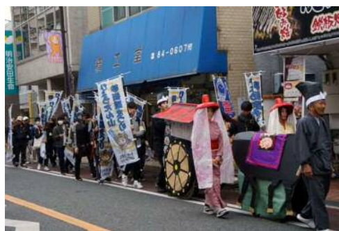
「第2回 ひょうたん山夢街道まつり」 時代行列パレード (28.11.6)