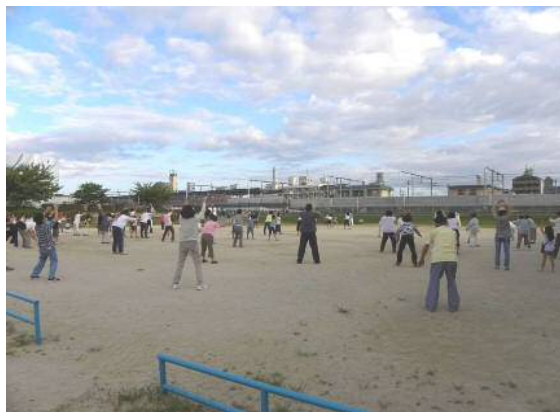
夏休み子供会とラジオ体操コラボ