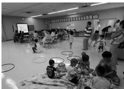
H28/8/5 JA 説明会