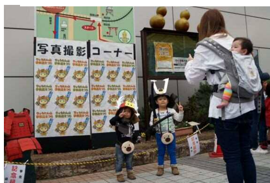
「第2回 ひょうたん山夢街道まつり」 記念写真コーナー(28.11.6)