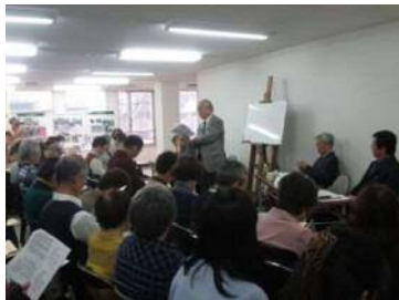
11月シンポジウム 「大阪の文化と経済を語る」