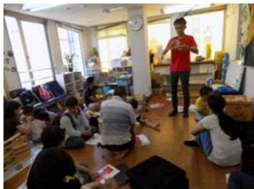
8月親子イベント・意見交換 (協力:関西グットトイ委員会)