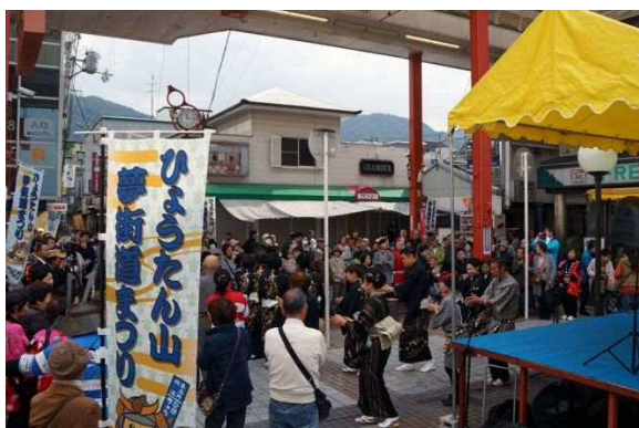
「第2回 ひょうたん山夢街道まつり」 せせらぎイベント(28.11.6)