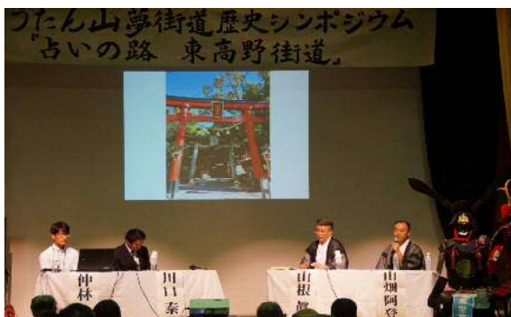
ひょうたん山夢街道歴史シンポジウム(28.7.31)