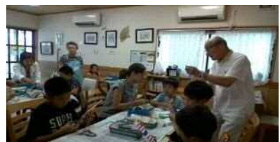
昔懐かしおもちゃづくり