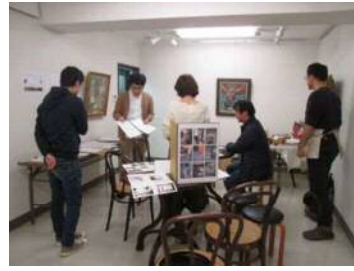
9~11月 空間調査・実測 若手チーム