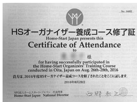
H28/8/26,27 オーガナイザー養成講座