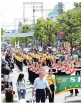
37団体が参加した昨年のパレード

今年で39回目を迎える「東大阪市民ふれあい祭り」は、ふれあい通り会場(近鉄布施駅〜八戸ノ里駅の北側道路)と花園中央公園会場の2会場で5月8日(日)に開催します。 また、前日の5月7日(土)には花園中央公園会場で、17時から河内音頭、20時から花火大会を行います。花火大会は、市花園ラグビー場のメインスタンドを観客席として開放しますので、家族そろってお越しください。入場