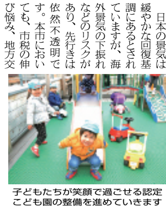
子どもたちが笑顔で過ごせる認定こども園の整備を進めていきます

3月に開かれた第1回定例会で、今年度予算が決まりました。一般会計の予算は、2091億円で前年度より151億1900万円の減額となっています。