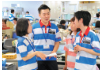
真剣にボールを奪い合う子どもたち(昨年の交歓会)