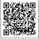
こちらからも予約できます

④ ④ ④ 〒市マイナンバーコールセンター(平日9時～17時30分、第4土曜日9時～12時) 0570(078)506(IP電話は050-3085-4999へ) ▷市民室 06(4309)3163、R06(4309)3012