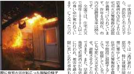
実際に住宅火災が起こった現場の様子