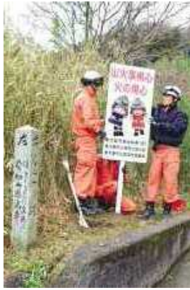
山林内に防火標識を設置

山の乾燥が進み、山林内には落ち葉や枯草が多く、また、暖かな気候のため、登山者も増え、林野火災の発生する危険性が高まっています。