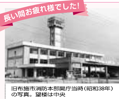
旧布施市消防本部開庁当時(昭和38年)の写真。望楼は中央

長い間お疲れ様でした! 西消防署の望楼撤去 旧布施市時代から本市の西地区を見守ってきた西消防署の望楼(火の見)が来年度取り壊されます。