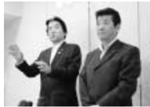
会談後に記者の質問に答える野田市長(左)と松井知事(右)