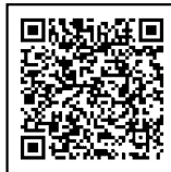
こちらから申込みできます

☎☎〒577-8521市役所市民協働室 06(4309)3319、FAX06(4309)3812、✉machikai@city.higashiosaka.lg.jp