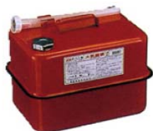
ガソリンの貯蔵に適した容器の例 (金属製容器であることが必要)