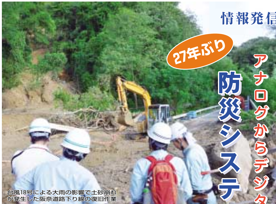
台風18号による大雨の影響で土砂崩れが発生した阪奈道路下り線の復旧作業