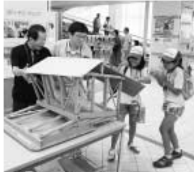
9月1日にイオン東大阪店で開催された住まいの防災イベントでは、参加者たちが家の耐震化について楽しく学びました。

住まいの耐震化について、皆さんは考えたことがありますか。 さまざまな災害を教訓に、住まいの安全性を今一度、確かめてみませんか。