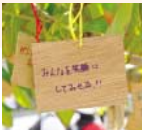
被災地を訪れたボランティアの思い

ボランティアについて認識を深め、これまでの活動を振り返るとともに、これからの活動を活性化するためのヒントやポイントなどを学びます。 ◇とき 3月21日(木)午後2時～4時 ◇対象 ボランティア活動をしていく方 ◇定員 40人(抽選) ◇申込方法 講座名、受講動機、住所、氏名、電話番号を3月14日(木)までに電話またはファクスで(直接も可) ◇ところ 申込み・問合せ先 総合福祉センター内ボランティア・市民活動センター