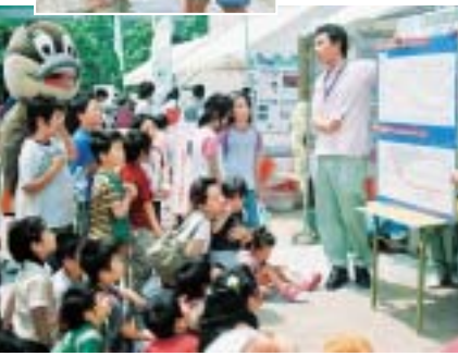
①親水池は子どもたちに大人気 ②環境の講話に聞き入りました

親しむ自然ゾーン。レジ袋を使った手作りの凧づくりに挑戦した子どもたちは、完成した凧を手に、喜びで笑顔をあふれていました。 また親水池では、魚釣りゲームやペットボトルのミニ水