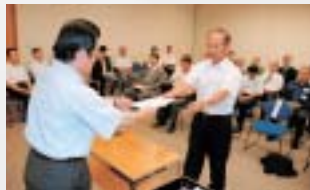
協議会委員の委嘱状交付式

問合せ先 危機管理室 06(4309)3130、 FAX 06(4309)3820