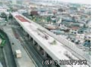
(仮称)柏田駅予定地