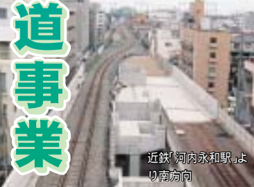
近鉄「河内永和駅」より南方向