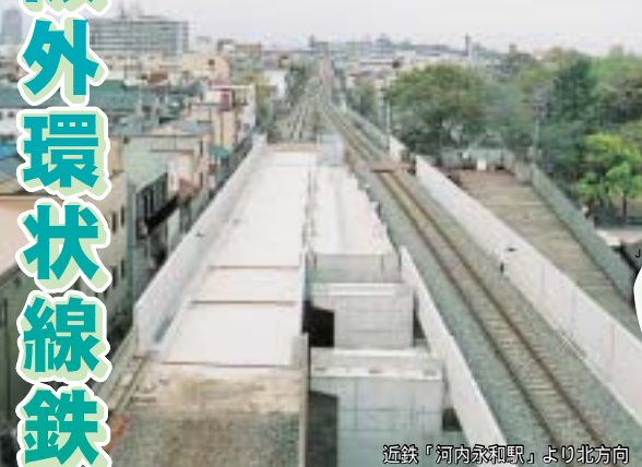
近鉄「河内永和駅」より北方向