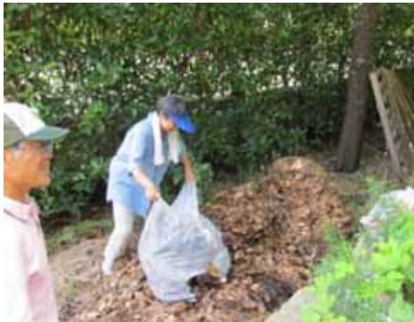
←公園の落葉の堆肥化