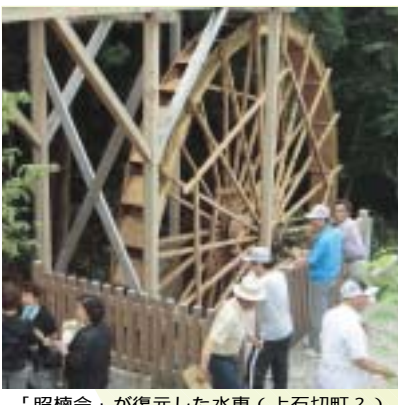
「昭楠会」が復元した水車(上石切町2)

情報の読み解き方をワークショップで学んでみませんか。 とき・内容 6月7日(木)メディアの働きについて何だろ、14日(木)どう描かれている?女性と男性 21日(木)メディアで、思いを届けよう、 いずれも午前10時、正午で計三日間 対象・定員 市内在住、在勤、在学の女性で全回受講できる方、二十人(抽選) 1歳6か月、就学前幼児の保育あり(一人二百円で要予約・定員八人) 申し込み先 y.hishinosakako@akajp