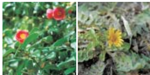
1月29日に撮影したヤブツバキ①とタンポポ②

地球温暖化だけではなく、光熱費の節約にもつながる環境家計簿。ぜひ参加してください。