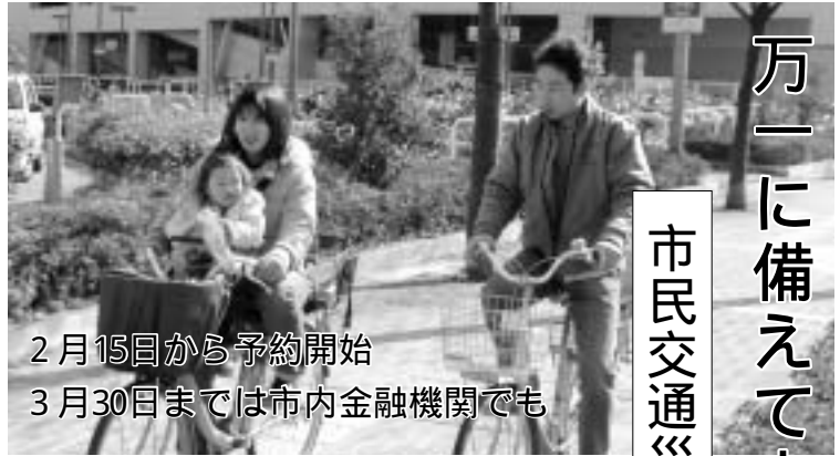
2月15日から予約開始 3月30日までは市内金融機関でも