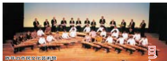
昨年の市民文化芸術祭