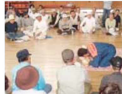
地域では自治会や自主防災組織などが中心になって定期的に防災訓練をされています(写真◎初期消火訓練 ◎救命講習会)