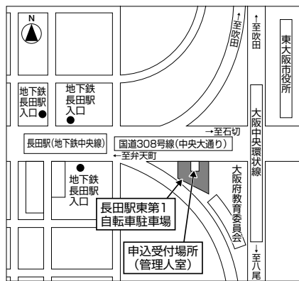
長田駅東第1自転車駐車場案内図