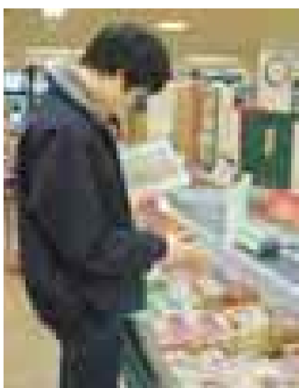
食品衛生監視員が市内のスーパーなど への立ち入り調査を実施しました

問合せ先 食品衛生課 072(960)38 03、FAX072(960) 3807