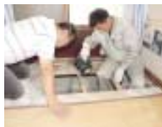
診断員は屋根裏や床下なども見ます

市では、一定の要件を満たす住宅やビルに対し、耐震診断の費用の一部を補助しています。この制度を利用すると、床面積120㎡以下の2階建木造住宅で、耐震診断費用が5万円の場合、所有者負担は5,000円です。ぜひ、ご利用ください。補助対象となる建物の要件は次のとおりです。