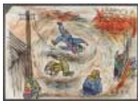
熱風(つむじ風)に翻弄される人々

東大阪市原爆被害者の会は、市内に住む広島・長崎で原爆の被害を体験した人が集まり、昭和38年に設立しました。戦争を知らない世代をはじめ、多くの人に戦争の悲惨さ、核兵器の恐ろしさを平和の尊さを伝えたいと願う人々の声や、戦争を体験した人々の声を聞いていただく場を設けています。