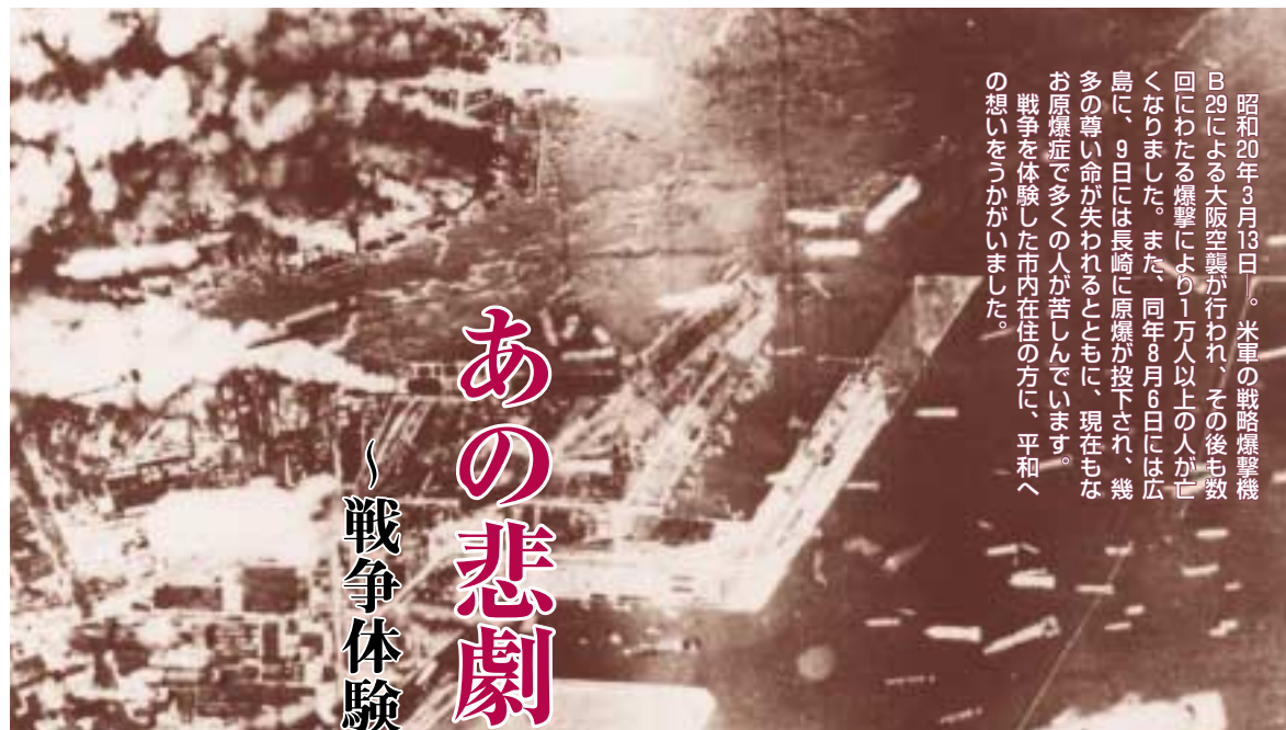
昭和20年3月13日。米軍の戦略爆撃機B29による大阪空襲が行われ、その後多数回にわたる爆撃により1万人以上の人が亡くなりました。また、同年8月6日には広島に、9日には長崎に原爆が投下され、幾多の尊い命が失われるとともに、現在もお原爆症で多くの人が苦しんでいます。戦争を体験した市内在住の方に、平和への想いをうかがいました。