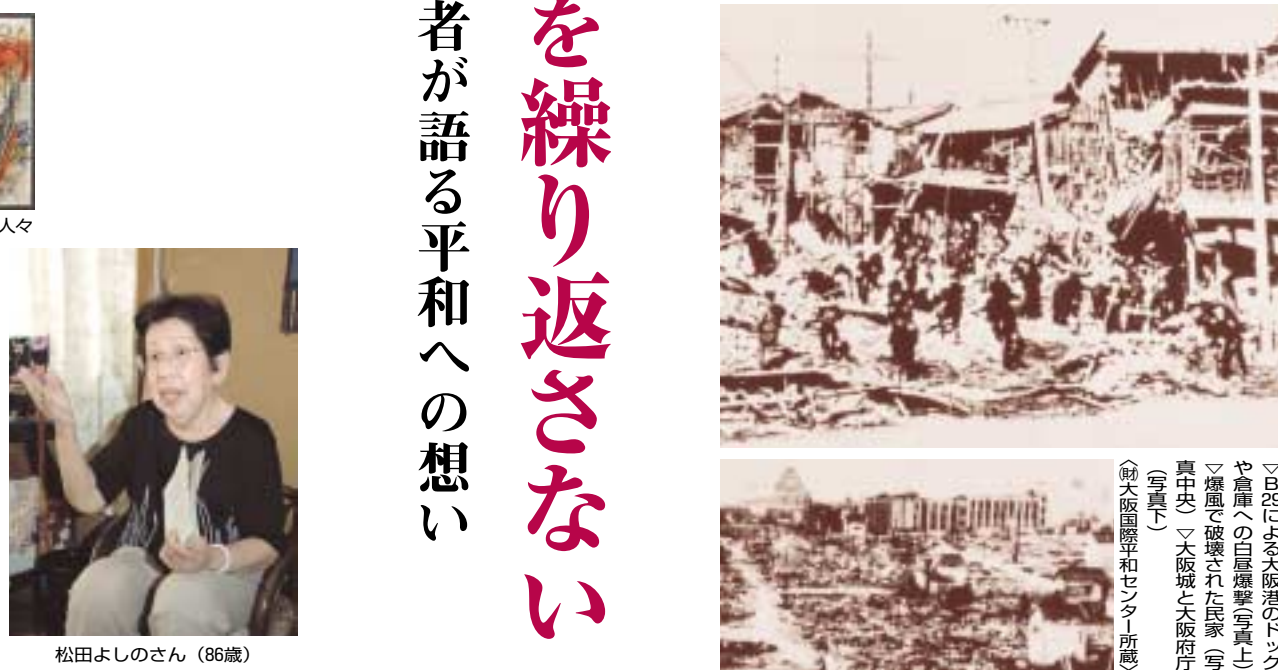
▽B29による大阪港のトンヤ倉庫への白昼爆撃写真上 ▽爆風で破壊された民家(写真中央) 大阪城と大阪府庁(写真下) (前大阪国際平和センター所蔵)