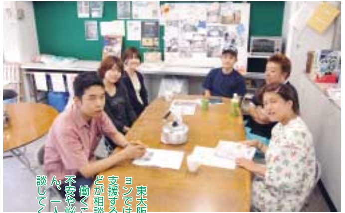
東大阪若者サポートステーションでは、若者の職業的自立を支援するため、カウンセラーなどが相談に応じています。働くことについてさまざまな不安や悩みをもっているみなさん、一人で悩まないで気軽に相談してください。