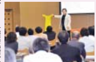
第1回デザインセミナーは約120人参加しました

◇ とき 8月27日(金) 午後2時～4時45分 ◇ ところ クリエイション・コア東大阪南館ラリエイターズプラザ ◇ 対象 市内製造業者 ◇ 定員 50人(申込先着順) ◇ 申込み・問合せ先 モノづくり支援室 06(4309)3177、R06(4309)3846、Eメール monodakuri@city.higashiosaka.lg.jp ※申込書はモノづくり支援室で配布。技術交流プラザホームページ http://www.techplaza.city.higashiosaka.osaka.jp からダウンロードもできます。