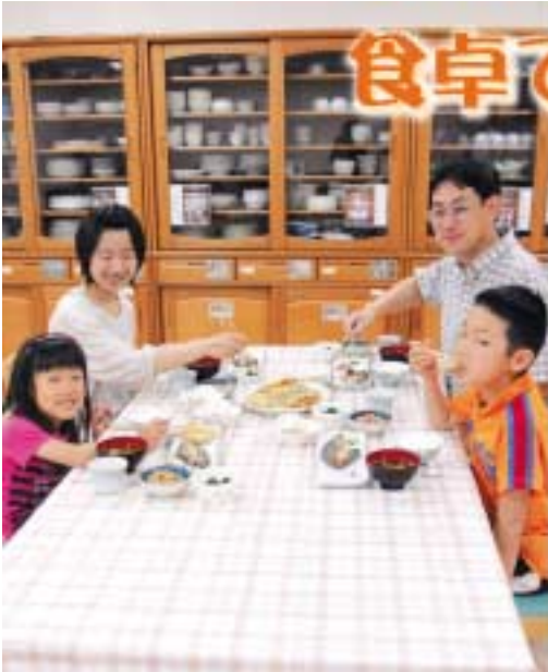
家族そろって食べるともっとおいしい

【野菜を育てよう】 野菜を育てることで命の大切さや感謝の心を育てることができます。また、自分で作った野菜はがっけいって食べられるようになります。ねぎやみょうろは、根がついていたら水につけておくだけでも成長し、土に植えるのもっと育ちます。まずは、簡単な水栽培から始めてみませんか。