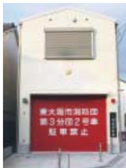
消防団の活動拠点である消防団屯所は市内に31か所あります

これまでの消防団男性中心の組織でしたが男女共同参画が進展し、時代にあった新しい消防団として、全国