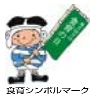
食育シンボルマーク