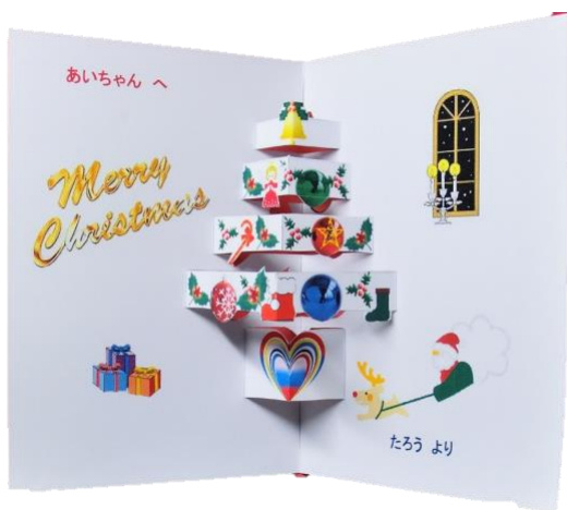
1. クリスマス・立体カード