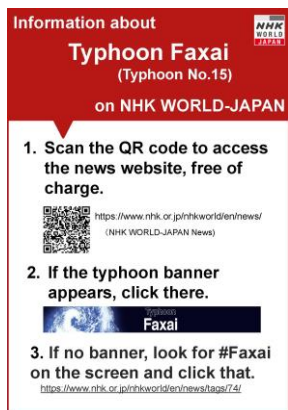
※台風15号 (Faxai) のチラシ

なお、ご利用いただいた場合は今後の外国人に向けた災害情報発信の参考にさせていただきますので、ご連絡いただけますと幸いです。